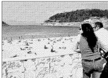
En primavera se detecta un alza del 30% en algunas operaciones.

Las operaciones más solicitadas son la lipoaspiración o modelaje corporal, el aumento de pecho y la cirugía de párpados. La mayor demanda de intervenciones quirúrgicas se produce entre las mujeres de entre 22 y 45 años. Uno de los mercados que está experimentando una mayor respuesta es el de los implantes mamarios. De hecho, el año pasado se vendieron 30.000 prótesis. Según los expertos, este negocio se está viendo enormemente beneficiado por la obtención de resultados más naturales y seguros. Por otro lado, entre las intervenciones que se van abriendo camino, se encuentran la de rejuvenecimiento de genitales en las mujeres y las técnicas postbariátricas para las personas que han perdido muchos kilos de peso. Asimismo, se detecta la tendencia de hacerse pequeños retoques faciales de manera más prematura y frecuente, tratando de evitar así intervenciones mayores en una consulta posterior.