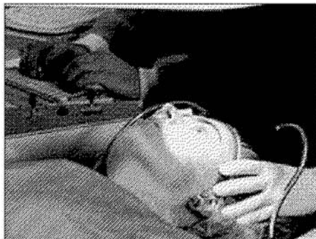
La mayor demanda de intervenciones se da entre los 22 y los 45 años.

La cirugía (palabra que procede de los términos griegos cheiros , que significa manos y ergon , trabajo) es la rama de la medicina que manipula físicamente las estructuras del cuerpo con fines diagnósticos, preventivos o curativos. Ambroise Paré, un cirujano francés del siglo XVI, le atribuyó cinco funciones: "Eliminar lo superfluo, restaurar lo que se ha dislocado, separar lo que se ha unido, reunir lo que se ha dividido y reparar los defectos de la naturaleza". Desde que el ser humano fabrica y maneja herramientas, ha empleado su ingenio también en el desarrollo de técnicas quirúrgicas cada vez más sofisticadas. Pero hasta la Revolución Industrial no se vencerían los tres principales obstáculos para esta especialidad médica desde sus inicios: la hemorragia, el dolor y la infección. Los avances en estos campos han transformado la cirugía de arte arriesgado en una disciplina científica capaz de los más asombrosos resultados.