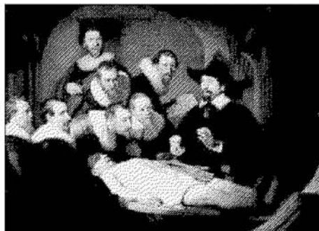
La hemorragia, el dolor y la infección han sido problemas históricos de la medicina.