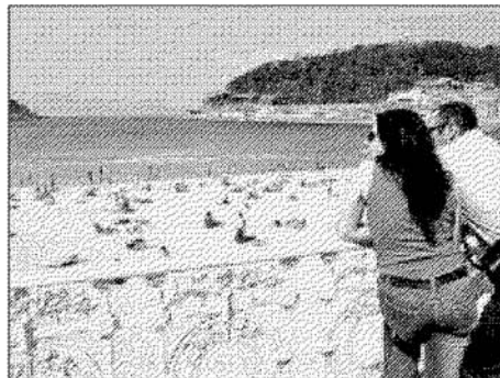
En primavera se detecta un alza del 30% en algunas operaciones.

Las operaciones más solicitadas son la lipoaspiración o modelaje corporal, el aumento de pecho y la cirugía de párpados. La mayor demanda de intervenciones quirúrgicas se produce entre las mujeres de entre 22 y 45 años. Uno de los mercados que está experimentando una mayor respuesta es el de los implantes mamarios. De hecho, el año pasado se vendieron 30.000 prótesis. Según los expertos, este negocio se está viendo enormemente beneficiado por la obtención de resultados más naturales y seguros. Por otro lado, entre las intervenciones que se van abriendo camino, se encuentran la de rejuvenecimiento de genitales en las mujeres y las técnicas postbariátricas para las personas que han perdido muchos kilos de peso. Asimismo, se detecta la tendencia de hacerse pequeños retoques faciales de manera más prematura y frecuente, tratando de evitar así intervenciones mayores en una consulta posterior.