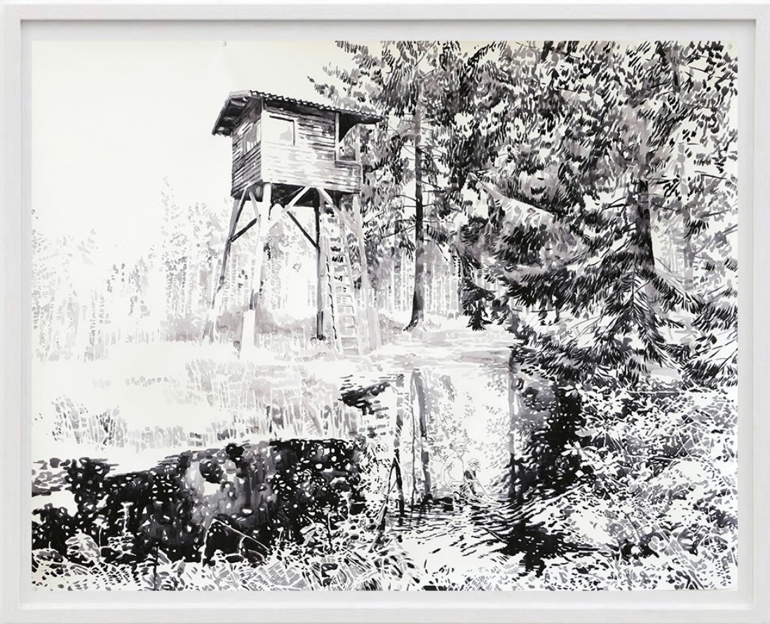
Zwei Brüder (Two Brothers), 2017 Acuarela y tinta sobre papel 100 x 130 cm 4600 EUR