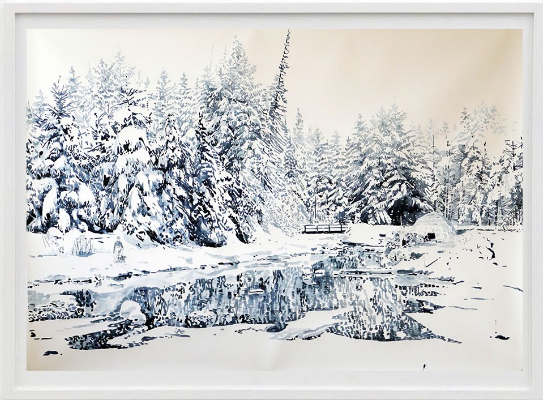
Der Fluss im Winter (The River in Winter), 2017 Acuarela y tinta sobre papel 110 x 155 cm 5500 EUR