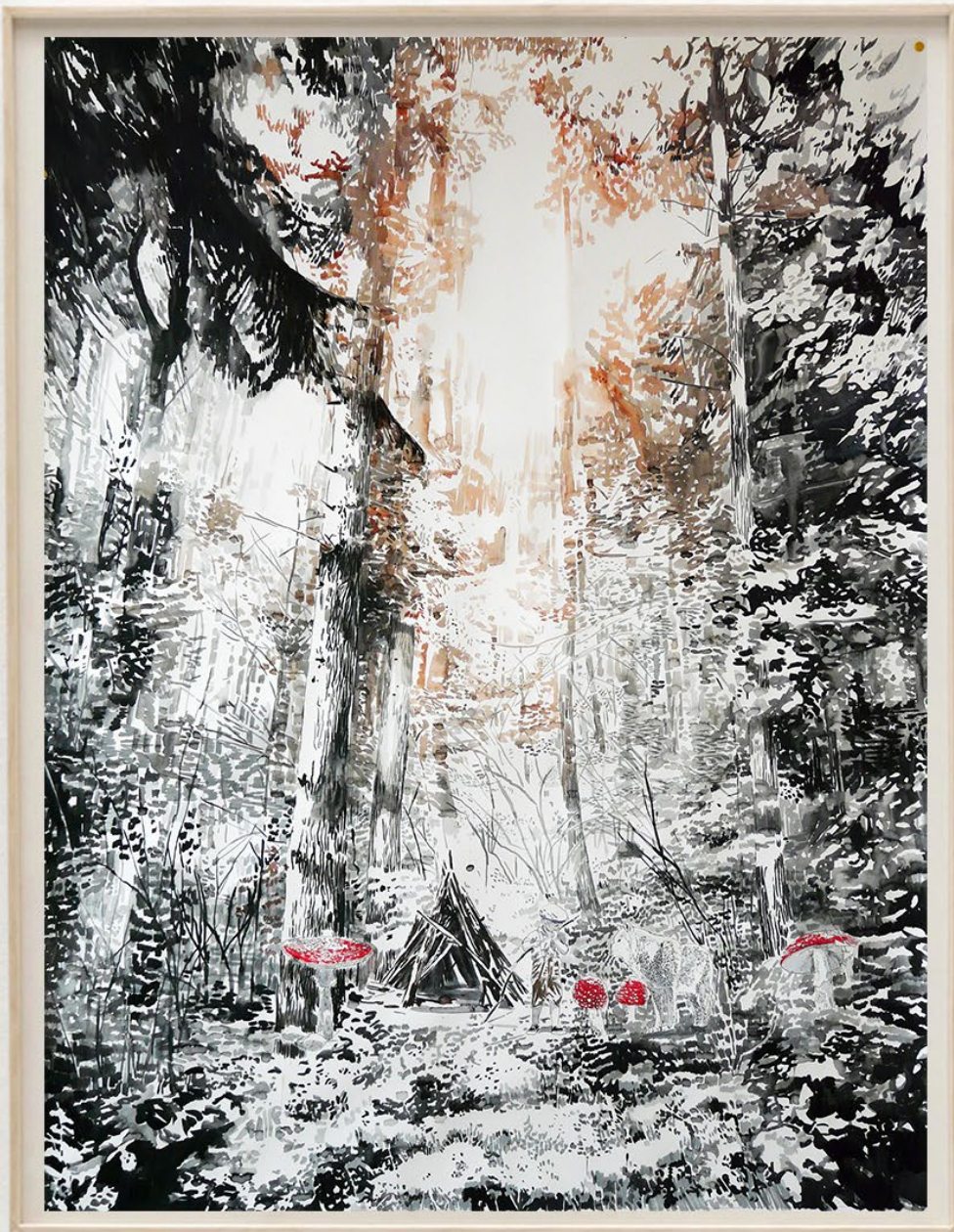
Black Forest, 2015 Acuarela y tinta sobre papel 130 x 110 cm 4600 EUR