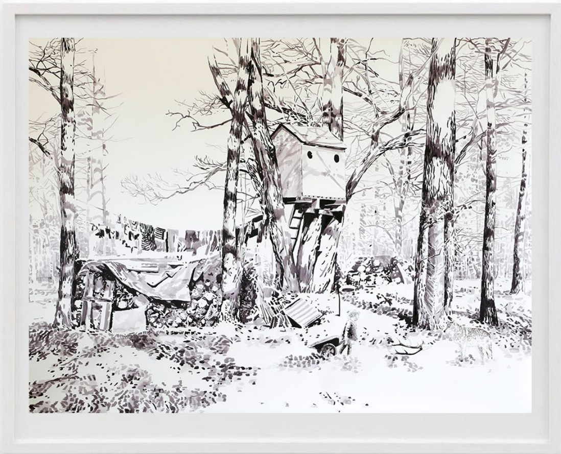
Zu Hase (At Home), 2017 Acuarela y tinta sobre papel 100 x 130 cm 4600 EUR