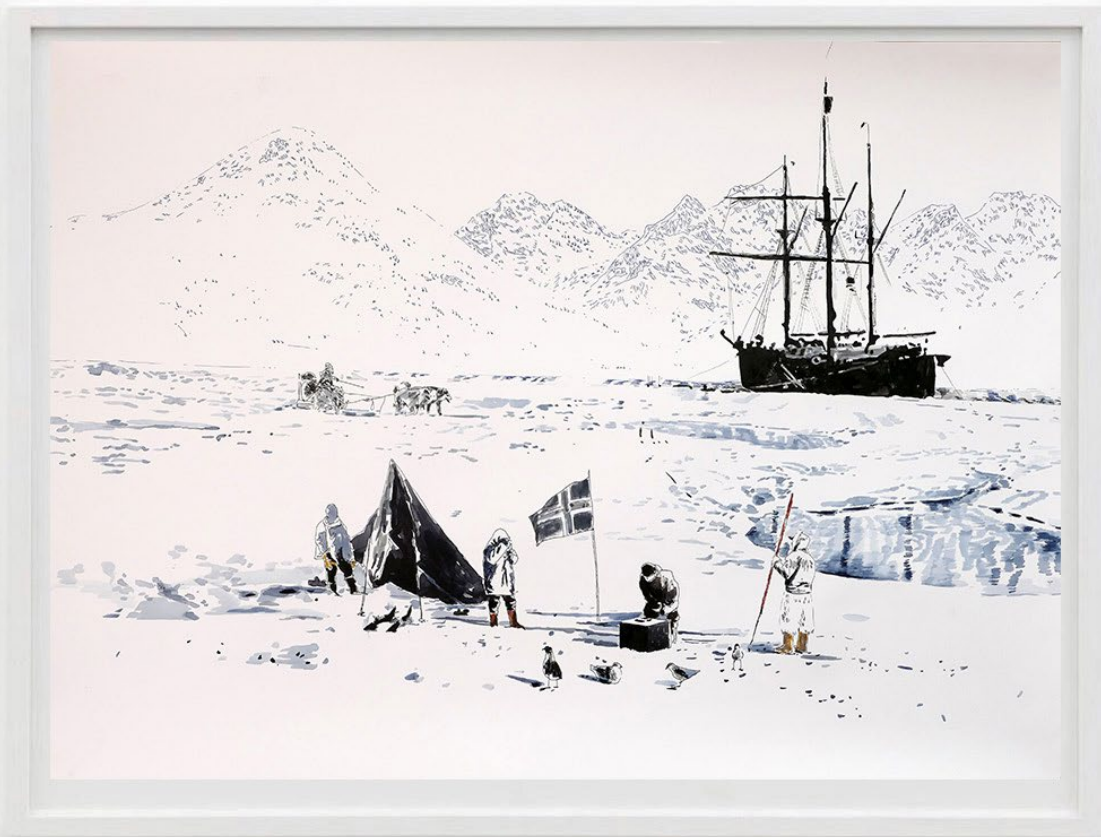
Expedition III, 2018 Acuarela y tinta sobre papel 50 x 70 cm 2400 EUR