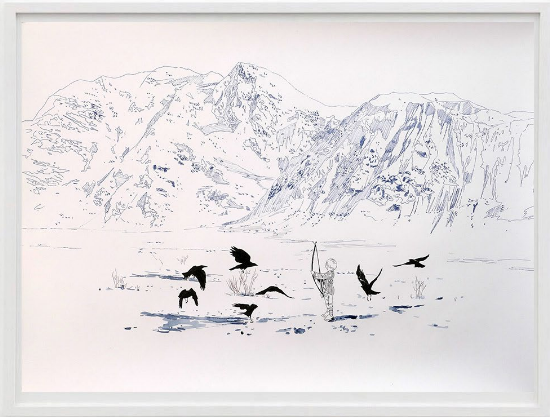
Mit Pfeil und Bogen (With bow and arrow), 2018 Acuarela y tinta sobre papel 48 x 68 cm 2400 EUR