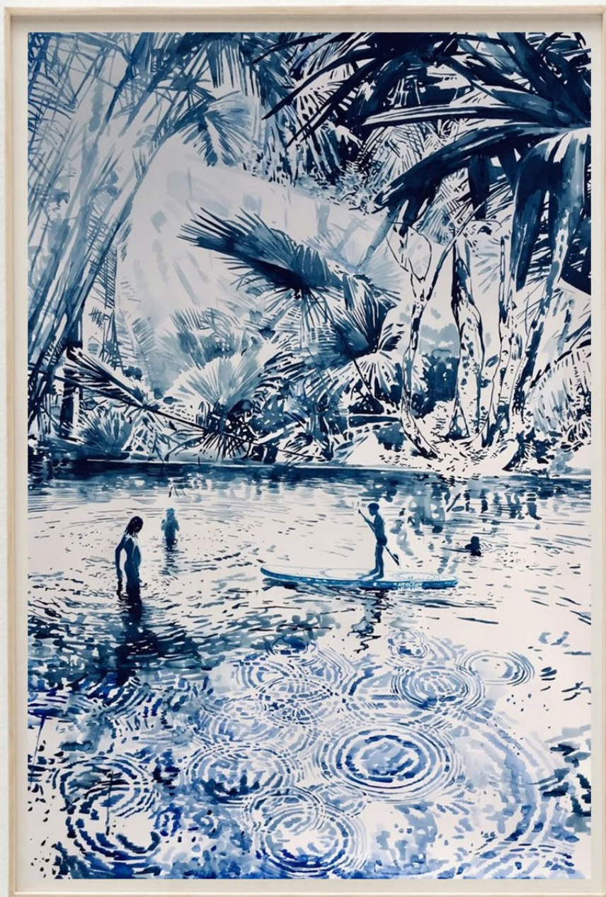
Regenwald, 2021 Acuarela y tinta sobre papel Watercolor and ink on paper 100 x 70 cm 3750 EUR