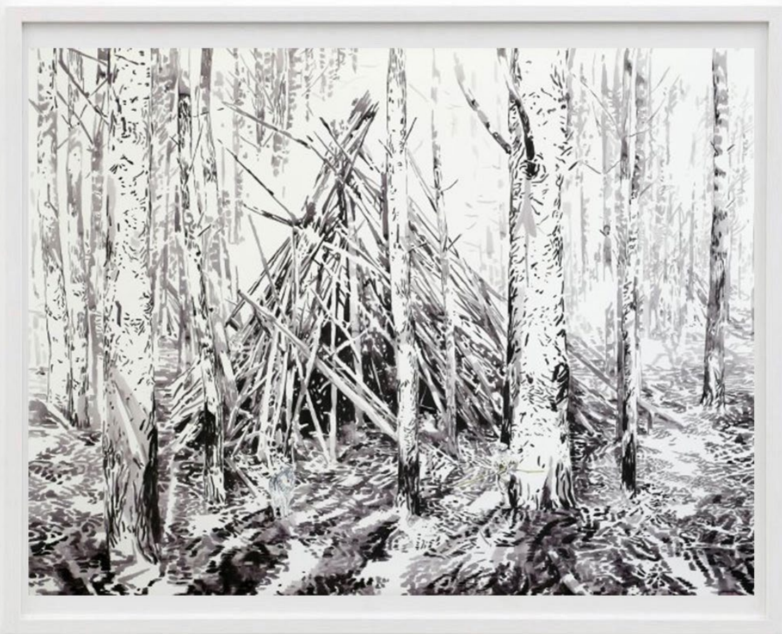
Schorfheide II, 2017 Acuarela y tinta sobre papel 100 x 130 cm 4600 EUR