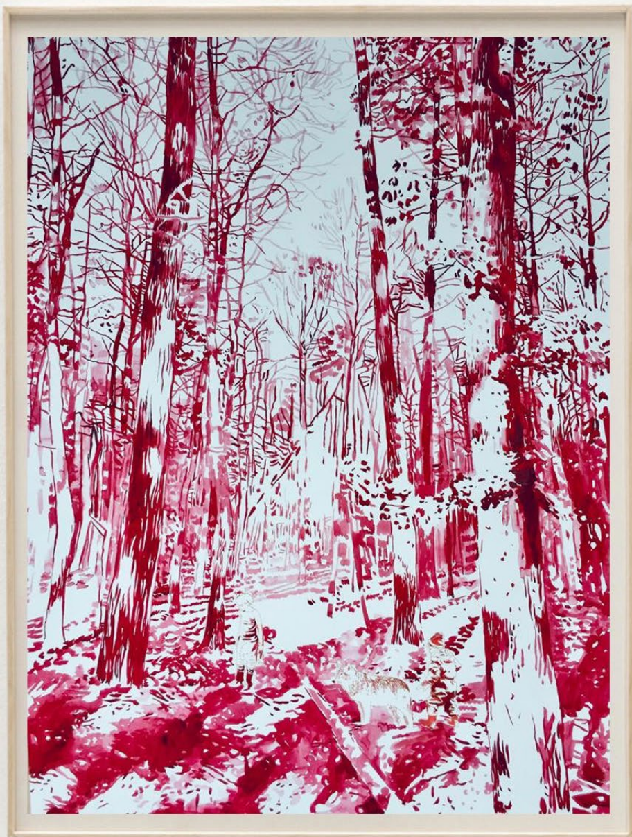
Drei im wald, 2019 Acuarela y tinta sobre papel Watercolor and ink on paper 87 x 68 cm 3400 EUR